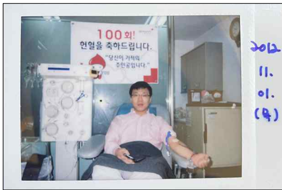
▲ 나이 34세, 100회 달성